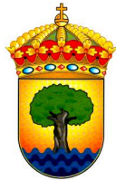
Castañar de Ibor (Cáceres)