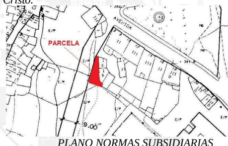
PLANO NORMAS SUBSIDIARIAS

«DESCRIPCIÓN DE LA PARCELA.- Se trata de una parcela que se encuentra delimitada por la actual alineación de las Normas Subsidiarias y las parcelas catastrales 6511304QE2461S0001SM, 6511305QE2461S0001ZM y 6511306QE2461S0001UM, sitas, respectivamente, en los números 26, 28 y 30 de la calle Del Cristo.