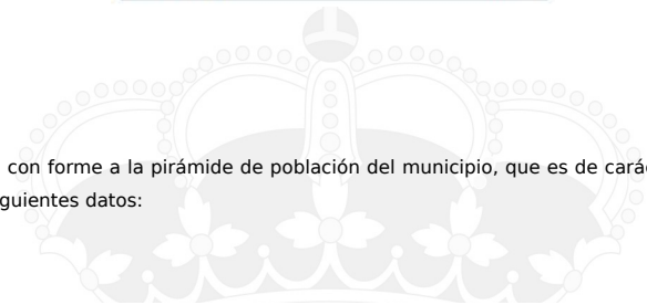
Pirámide de Población

Por otra parte, con forme a la pirámide de población del municipio, que es de carácter recesivo, se obtienen los siguientes datos: